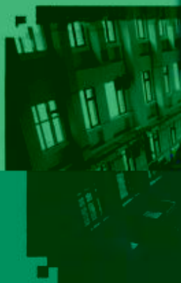
CNC 数控技术 训练场所