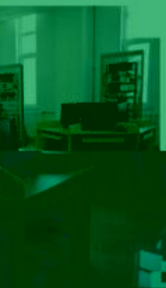
一体化课程教学设计 综合实训室